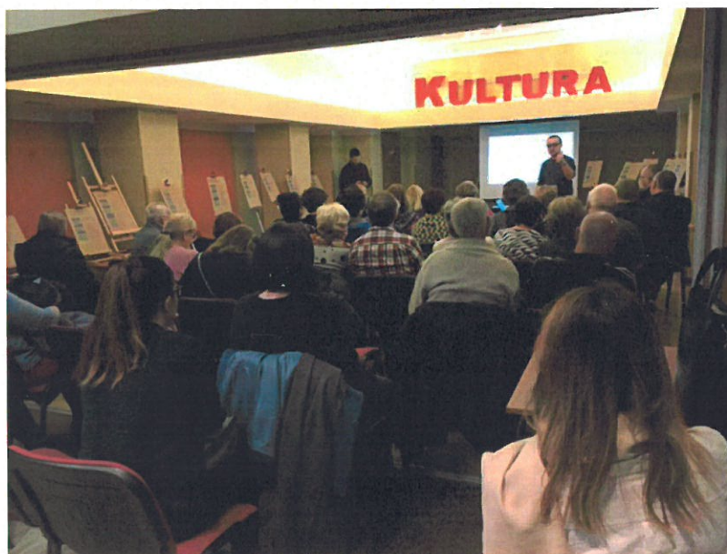
II spotkanie konsultacyjne 18.02.2020

Poszczególne inicjatywy planowane do realizacji w ramach Planu angażowania mieszkańców i partnerów społecznych na lata 2020-2022 zostały przedstawione w ramach trzech priorytetów kluczowych wynikających z potrzeb opisanych w diagnozie ww. dokumentu: