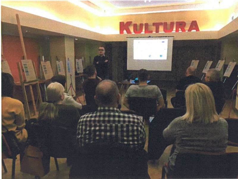
I spotkanie konsultacyjne 11.02.2020