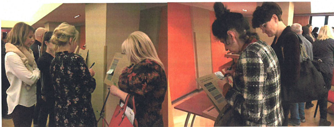
II spotkanie konsultacyjne 18.02.2020

Po zapoznaniu się z propozycjami inicjatyw w ramach trzech priorytetów, każdy z uczestników indywidualnie zapisywał swoje uwagi i pomysły na kartkach (possit) i przylepiał do poszczególnych inicjatyw. Metoda ta zdecydowanie sprzyjała osobistym refleksjom, bez ewentualnej tendencji "wpływu myślenia grupowego". Sprzyjało to również ważnemu celowi konsultacji, aby wytworzyć atmosferę - "każdy głos jest ważny". Metoda ta również sprawiła, że uczestnicy mogli zapoznać się z innymi uwagami uczestników, które sprzyjały kreatywnemu myśleniu. Uczestnicy dołączyli swoje uwagi do każdej z inicjatyw.