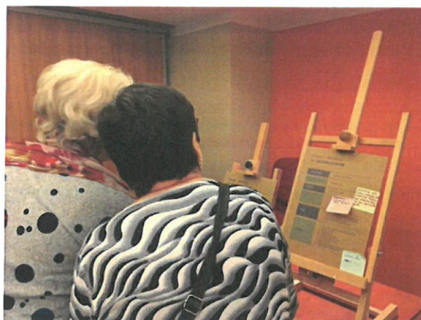
II spotkanie konsultacyjne 18.02.2020