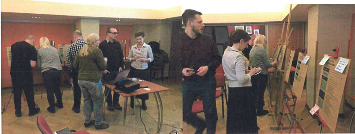
I spotkanie konsultacyjne 11.02.2020