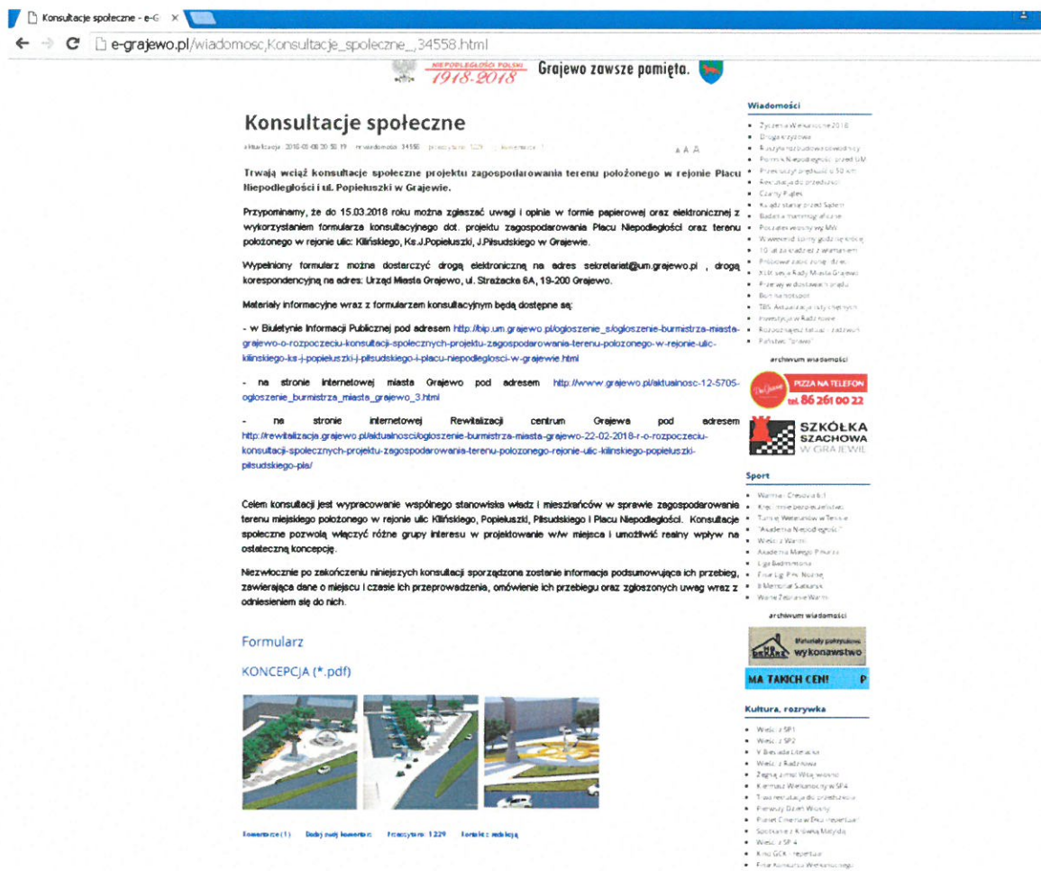
Rysunek 8. Zrzut z ekranu ze strony www.e-grajewo.pl z dn. 26.03.2018 r.